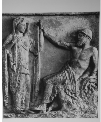
Resim 1.3: Hieros Gamos (Şahin, 2013, s. 293, Res. 10.)