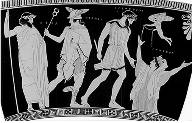
Resim 1.1: Pandora'nın Yaratılışı (Şahin, 2013, s. 285, Res.1)

buyruğu dinlemez bir kadın kimliğidir. Kadın düşmanlığı açıkça izlenir Hesiodos'un bakış açısında.